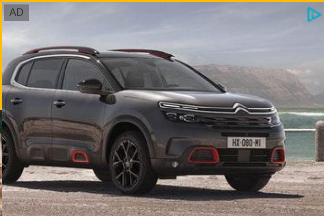
Nuovo SUV Citroën C5 Aircross. Comfort Class SUV. Scoprilo anche domenica Citroën Italia