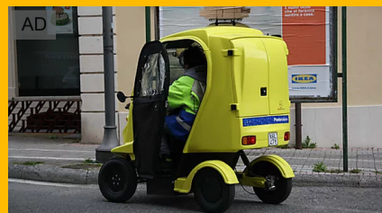
Investi 200€ su Poste Italiane e ottieni una rendita mensile Invest Advisors