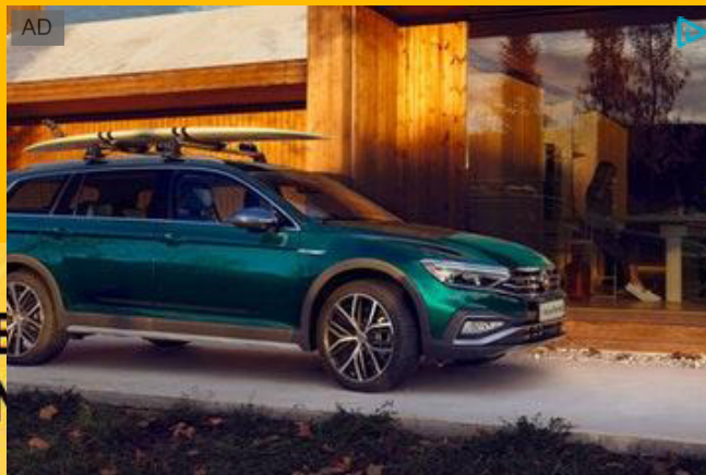
Nuova Passat. Più spazio al tuo tempo. Scopri di più