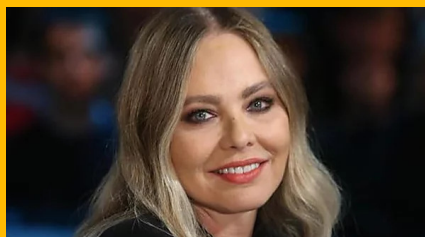
Si diede malata ma era a cena con Putin, condannata Ornella Muti - Cronaca