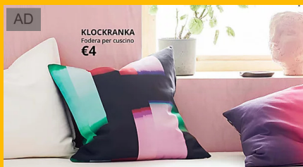
IKEA lancia prodotti per lo spazio. Di casa tua. E del tuo soggiorno. Ikea.com